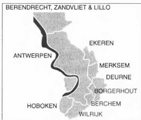
Figuur 1 : Kaart van de Antwerpse districten