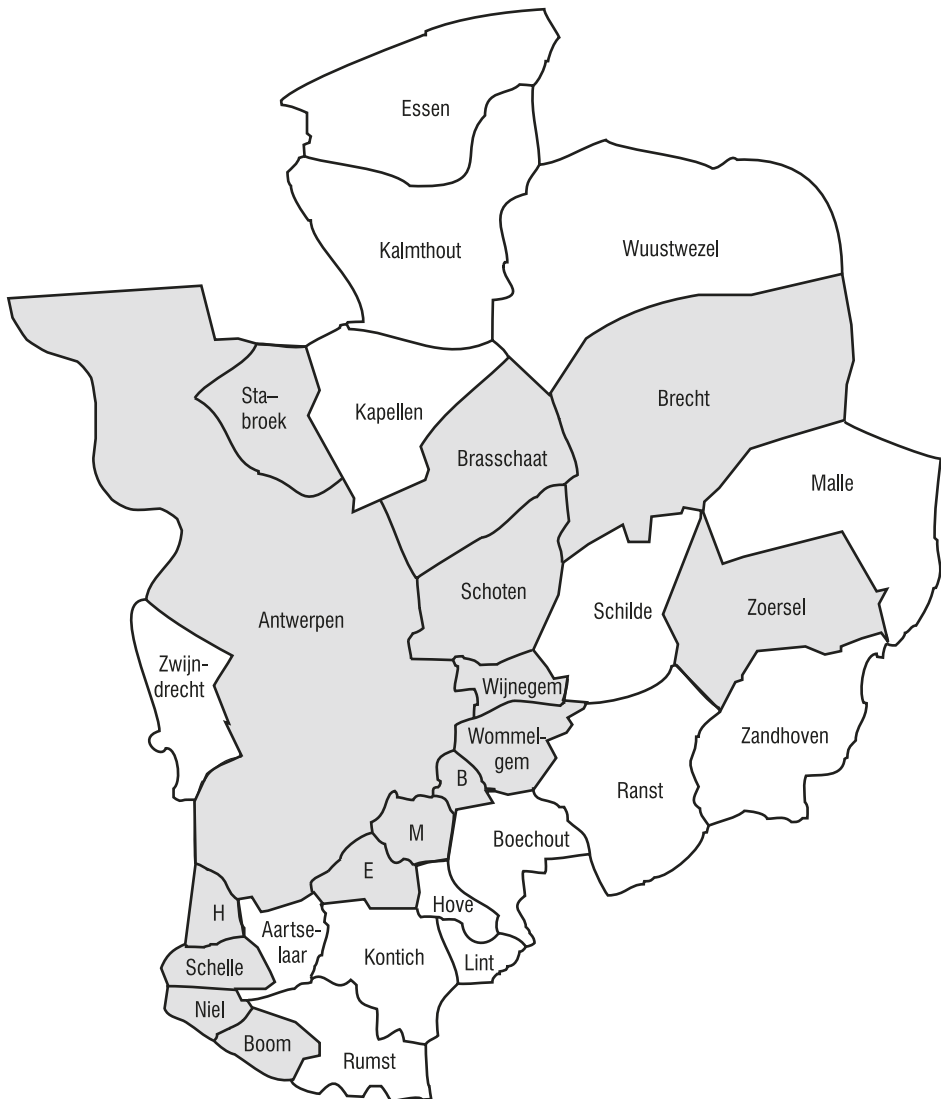
Figuur 1. Geografische verdeling van de VB scores in de Antwerpse gemeenten.

Deze illustratie onthult een interessant gegeven. Over het algemeen kunnen we stellen dat hoe verder men van de stad is verwijderd, hoe kleiner de kans is dat men voor het VB stemt. Hierop zijn uiteraard uitzonderingen zoals Zwijndrecht en Zoersel. Toch is de geografische spreiding van extreem-rechts stemgedrag specifiek en zetten we het fenomeen voortaan onder de noemer inktvlekmodel.