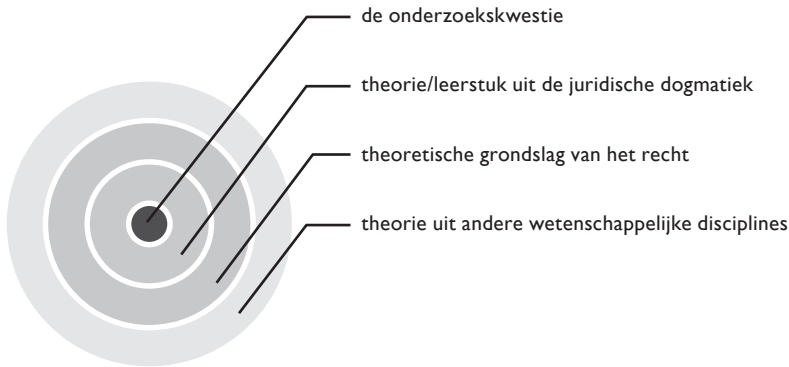
Figuur 2 Drie mogelijke theoretische kaders

zoek dient het expliciteren van het theoretisch kader dus de controleerbaarheid van het onderzoek, door het zichtbaar maken van de keuzes die de onderzoeker maakt. Alleen wanneer de criteria aan de hand waarvan de onderzoeker een analyse maakt of een oordeel velt vooraf bekend zijn, is het oordeel controleerbaar en niet willekeurig. Ook als het onderzoek tot doel heeft om een ontwerp te maken, gebeurt dit niet op basis van eigen voorkeuren, maar uitgaande van een wensenpakket dat voortvloeit uit een bepaalde opvatting over bijvoorbeeld functionaliteit, rechtvaardigheid of legitimiteit.